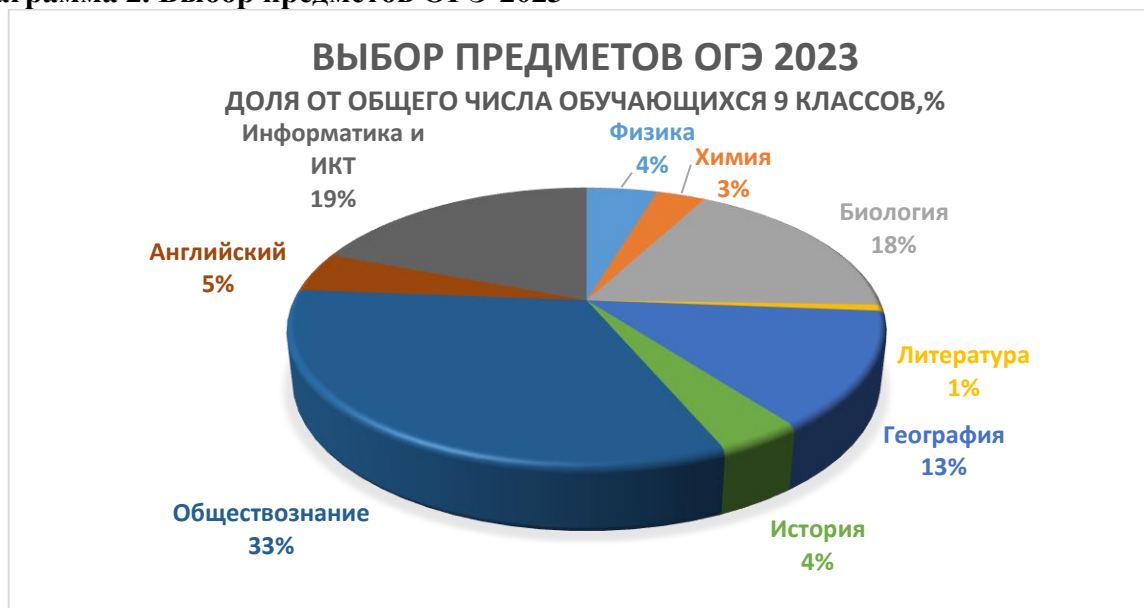
Диаграмма 2. Выбор предметов ОГЭ-2023

Замечаний о нарушении процедуры проведения ГИА-9 в 2023 году не было, что является хорошим результатом работы с участниками образовательных отношений в сравнении с предыдущим годом.