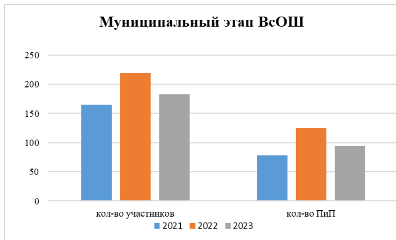
Таблица 23. Достижения обучающихся