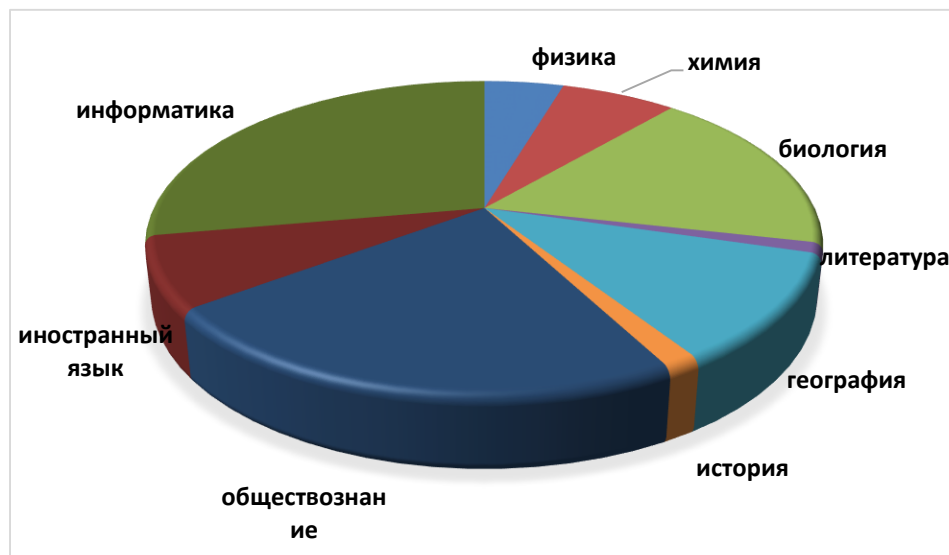
Диаграмма 2 Выбор предметов ОГЭ-2025

Замечаний о нарушении процедуры проведения ГИА-9 в 2025 году не было, что является хорошим результатом работы с участниками образовательных отношений.